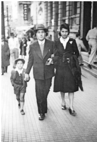
2. Aos cinco anos, elegante, ao lado do pai e da mãe, caminhando pelas calçadas da São Paulo do início dos anos 1940.