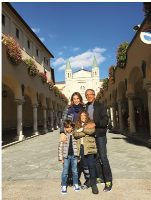
26. A família em frente à Basílica de Santa Rita, em Cássia (Itália), para onde vai todos os anos.