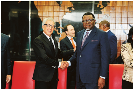
42. Junho de 2016, Abilio Diniz com o presidente da Namíbia, Hage Geingob: oportunidades de investimento da BRF no país africano.