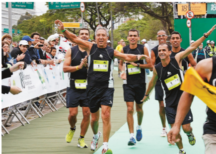
19. Em 2010, na Maratona de Revezamento do Pão de Açúcar, fazendo o “aviãozinho” da chegada com o ícone do esporte olímpico brasileiro, Vanderlei Cordeiro de Lima.