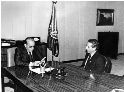
14. No início do governo Figueiredo, em 1979: "Meu amigo Mário Henrique Simonsen me ofereceu um posto no Conselho Monetário Nacional".